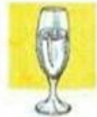
a glass of water