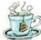
a cup of tea