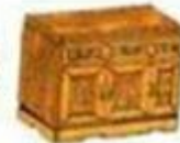
a piece of furniture