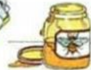
a jar of honey