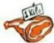
a kilo of meat