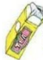
a packet of tea