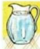
a jug of water