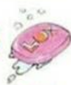
a bar of soap